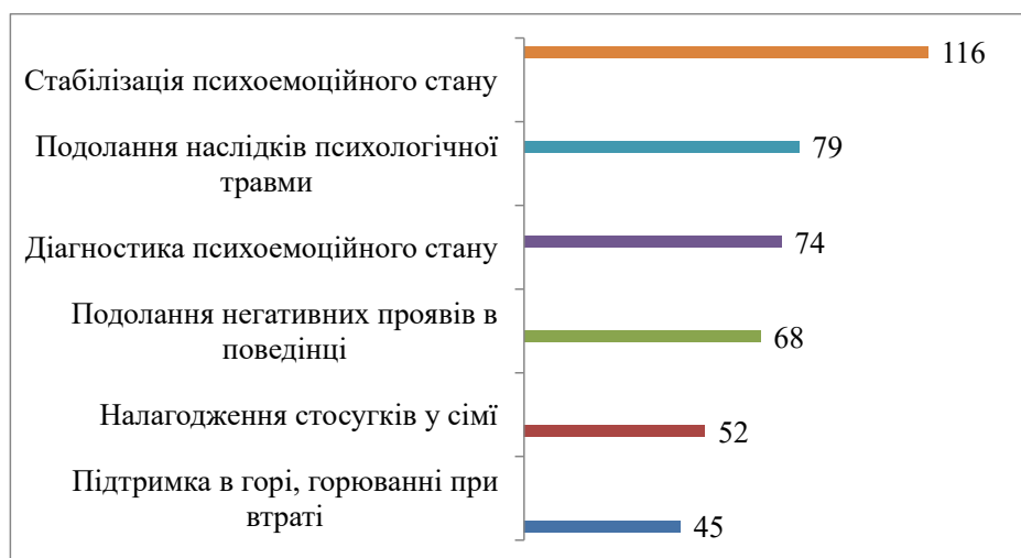
Рис. 1. Тематика роботи та кількість дітей, підлітків, що були охоплені системою психологічною допомогою в закладах освіти області

В рамках дослідження опитаним респондентам пропонувалось оцінити рівень власної фахової компетентності щодо надання психологічної допомоги і підтримки постраждалим від війни учасникам освітнього процесу та ВПО за 10-бальною шкалою.