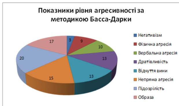
Рис. 1. Показники рівня агресивності за методикою Басса-Дарки, у %

Результати дослідження за такою методикою зображено на рисунку 1.