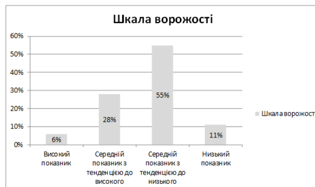
Рис. 3.3. Діагностика ворожості за шкалою Кука–Медлей

Результати дослідження за такою шкалою зображено на рисунку 3.3.