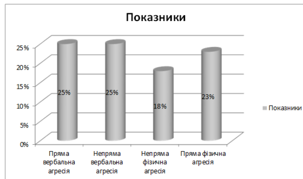
Рис. 2. Показники рівня агресивної поведінки за методикою Є. Ільїна та П. Коновалова

Результати дослідження за такою методикою зображено на рисунку 2.