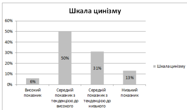
Рис. 3.1. Діагностика ворожості за шкалою Кука–Медлей

У 12% досліджуваних виявлено високий показник за шкалою агресивності, у 41% студентів середній показник з тенденцією до високого, у 47% досліджуваних середній показник з тенденцією до низького. Низький показник за шкалою агресивності у групі досліджуваних відсутній. Високий показник за цією шкалою свідчить про схильність до агресивного усунення і руйнування перешкод, подолання всього того, що протидіє особистості. Особливість може проявлятися в активному загостренні конфліктних ситуацій, гнівних реакцій, погроз або прагненням до застосування фізичної сили.