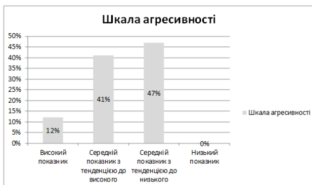
Рис. 3.2. Діагностика ворожості за шкалою Кука–Медлей

Результати дослідження за такою шкалою зображено на рисунку 3.2.