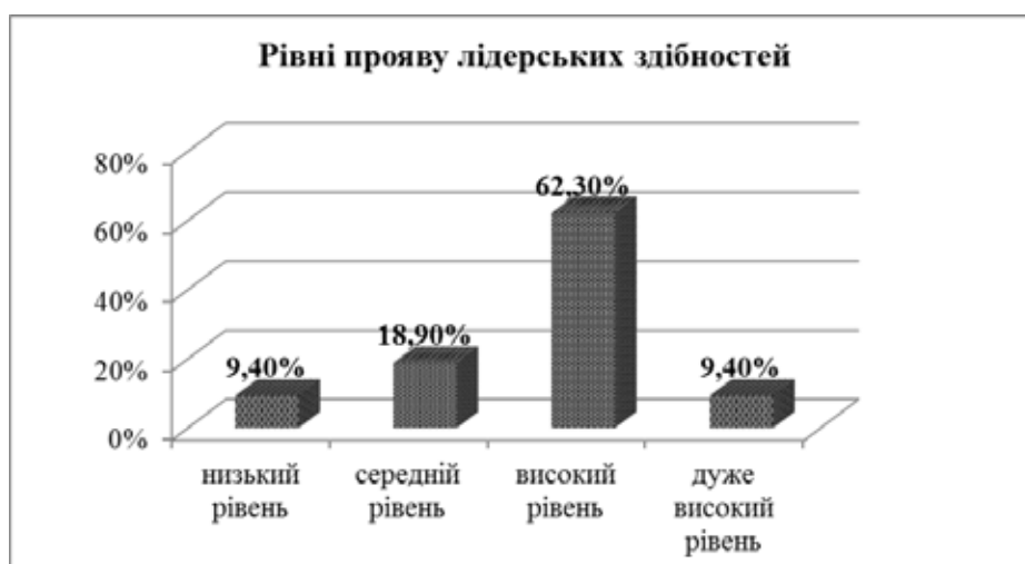
Рис. 2. Рівні прояву лідерських здібностей

Разом з тим, виявився обернений зв'язок між показниками «сміливість» – «пристрасність» ( r=-0,399 при p=0,001 ) та «винахідливість» ( r=-0,408 при p=0,001 ). Вміння знаходити вихід зі складних ситуацій, невтомність та енергійність, особливо для військового лідера мають не аби яке значення, але в умовах військової служби, під час виконання бойових завдань, ці якості