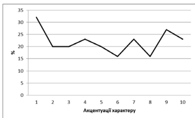
Рис. 1. Результати методики на визначення акцентуації характеру (Г. Шмішик) у % значенні

Результати за методикою на визначення акцентуації характеру (Г. Шмішик) зображено на рис. 1.