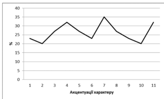
Рис. 2. Результати методики ПДО у % значенні

Примітки: 1 – Гіпертимний; 2 – Циклоїдний; 3 – Лабільний; 4 – Астено-невротичний; 5 – Сензитивний; 6 – Психостенічний; 7 – Шизоїдний; 8 – Епілептоїдний; 9 – Істероїдний; 10 – Нестійкий; 11 – Конформний.