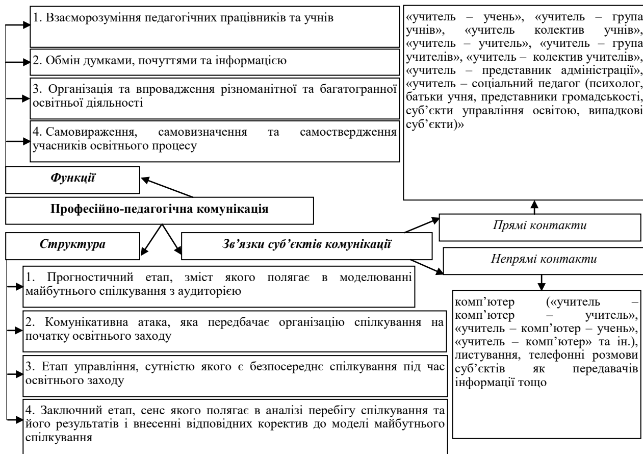
Рис. 1. Модель професійно-педагогічної комунікації