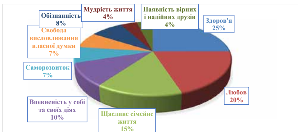
Рис. 3. Методика «ціннісні орієнтації» М. Рокича

Визначити кореляцію між готовністю молоді до шлюбу та ступенем розвитку таких якостей особистості, як емпатія, зрілість особистості, відповідаль-