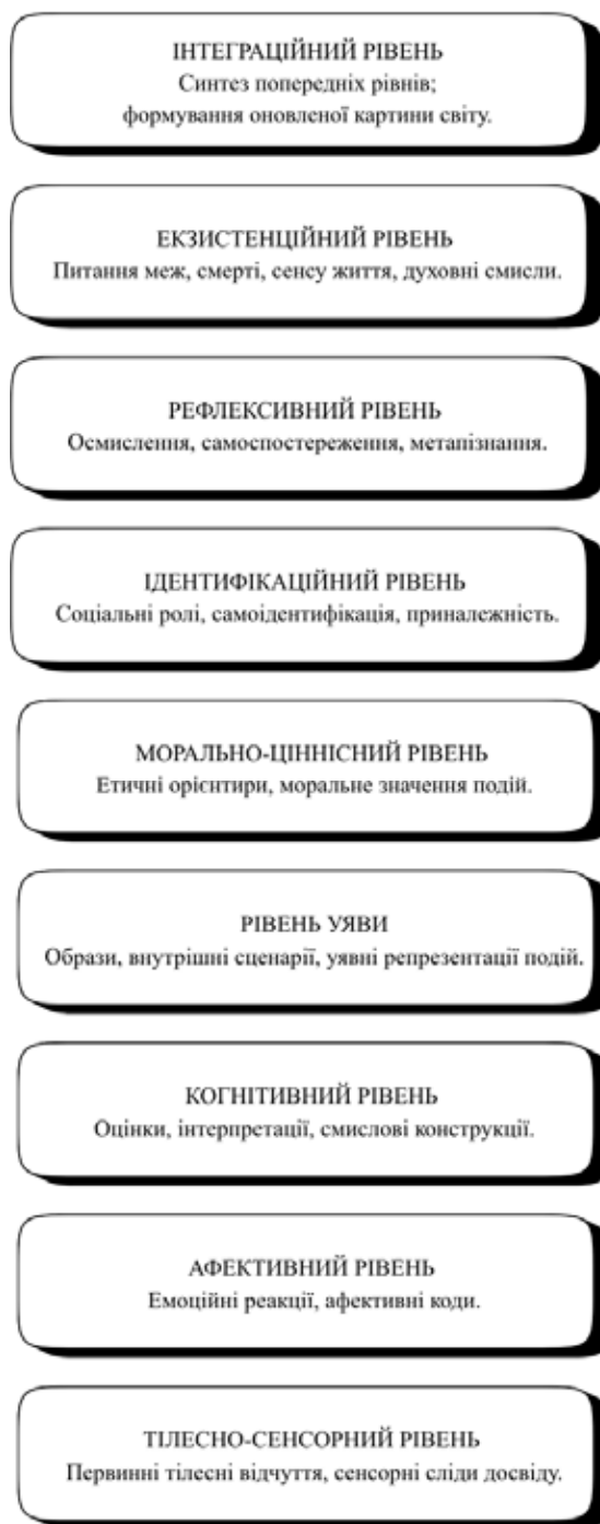
Рис. 1. «Структурна модель архітекtonіки смислів військовослужбовця-учасника бойових дій»

Така структура підкреслює, що динаміка смислової системи має поетапний і накопичувальний