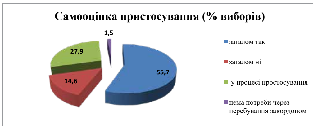
Рис. 2. Самооцінка ступеня пристосування підлітків до змін, пов'язаних з війною в Україні

Водночас 35,5% підлітків (здебільшого тих, хто на момент опитування перебував в Україні) засвідчили зростання власної резильєнтності, вважаючи, що необхідність протистояти стресу зробила їх сильнішими. Очевидно, потребують адресної психоло-